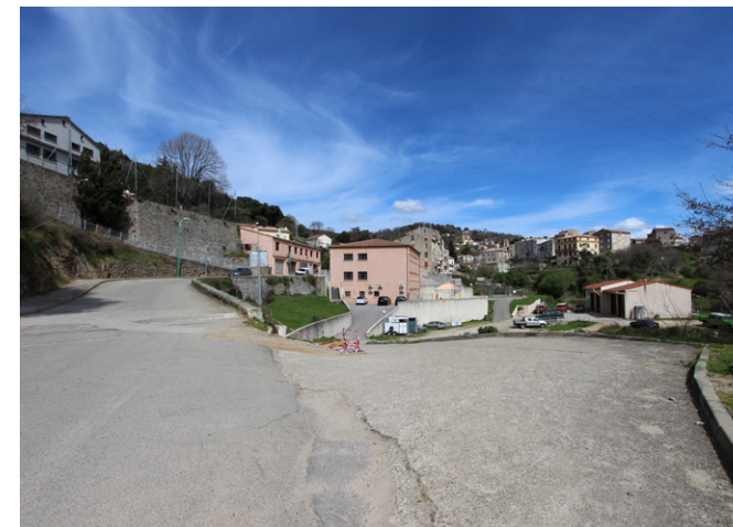
Vue d'une future zone de stationnement - Etat actuel