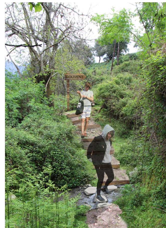
Vue du sentier entre le couvent Saint-François et le village - Etat projeté