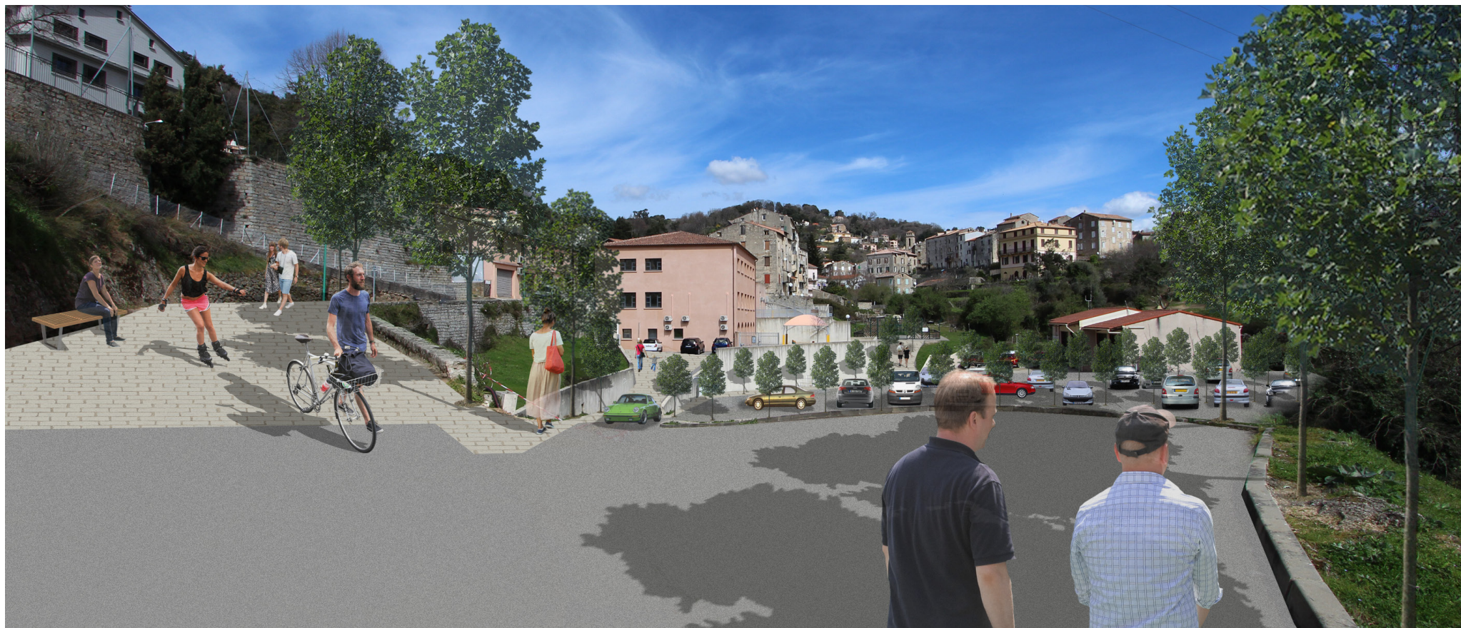
Vue d'une future zone de stationnement - Etat projeté