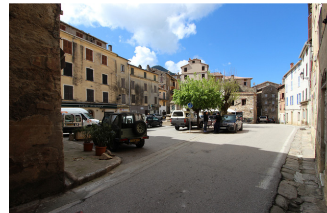
Vue de la place Casanella D'Istria - Etat actuel