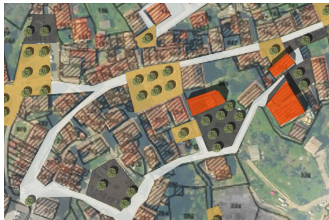
Repérage sur plan masse

L'accent est sur mis la cohérence de la signalétique (panneaux de direction, enseignes, panneaux explicatifs, noms des rues, etc.) dans le centre bourg, selon la nouvelle charte mise en place. Les revêtements des sols sont repris dès que possible pour améliorer le confort des piétons et cyclistes et les placer au coeur du dispositif. Les abords des routes et des places sont végétalisés.