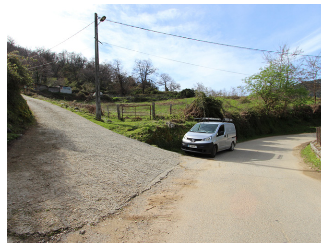
Vue d'un futur équipement, le pôle culturel - Etat actuel