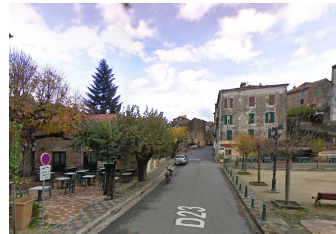
Vue depuis l'actuelle mairie - Etat actuel