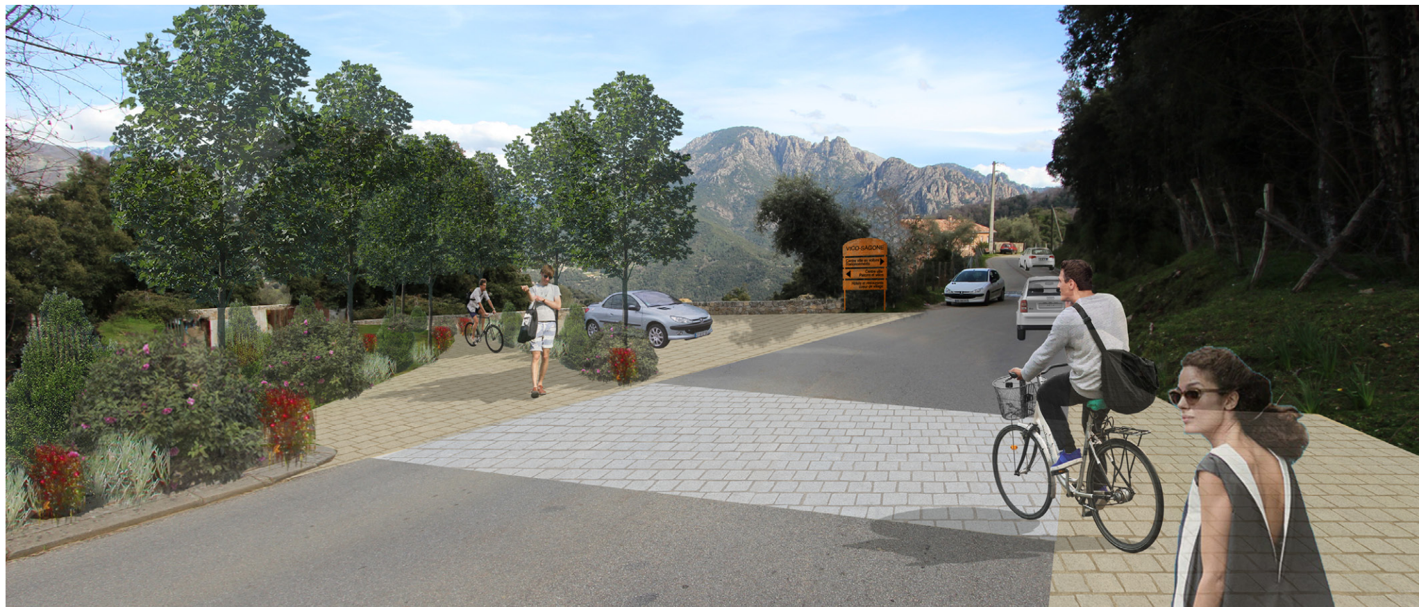
Intersection entre accès actuel au village et future voie de contournement - Etat projeté