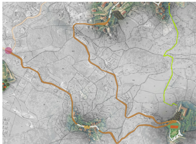
Repérage sur plan masse

Depuis cette intersection jusqu'au cœur de Vico, les accès se feront partagés entre voitures, vélos, et piétons, avec la présence de zones 30.