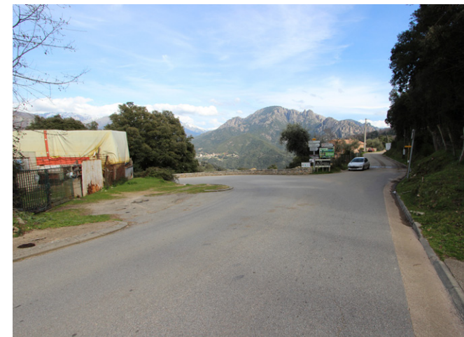
Intersection entre accès actuel au village et future voie de contournement - Etat actuel