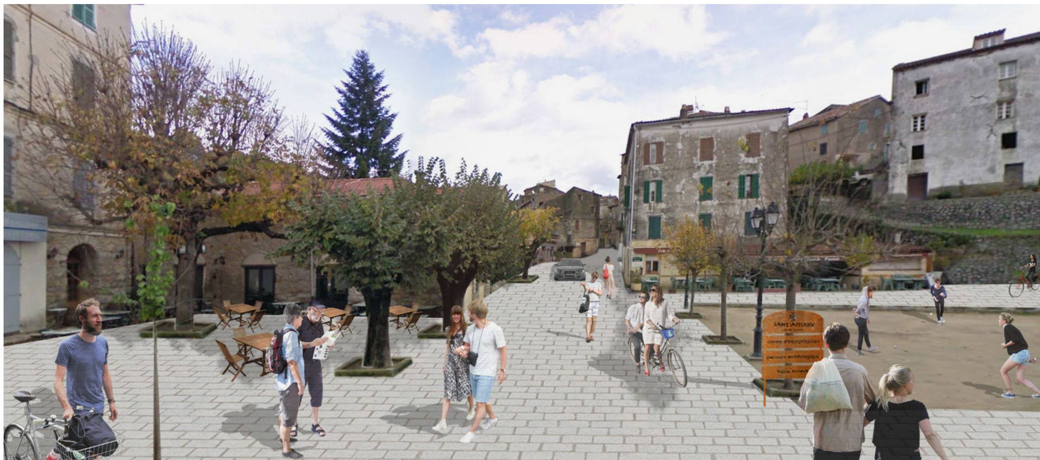
Vue depuis l'actuelle mairie - Etat projeté