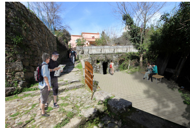
La place de la fontaine - Etat projeté