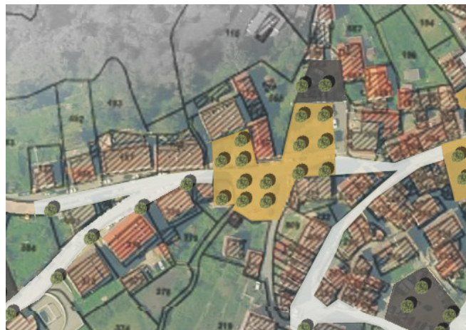
Repérage sur plan masse

Un réseau de places et d'espaces publics qualifiés est aménagé dans le cœur ancien du village de Vico, dont l'ensemble est placé en zone 30. Les circulations douces deviennent prioritaires, les places sont pensées comme des lieux de partage et de rencontre, la voiture étant maintenant dans des zones de stationnement dédiées. Signalétique, mobilier urbain et éclairage seront traités avec une attention particulière.