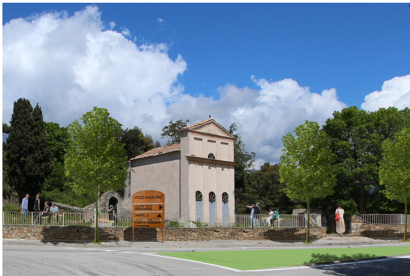
Aménagement des abords de la chapelle - Etat projeté