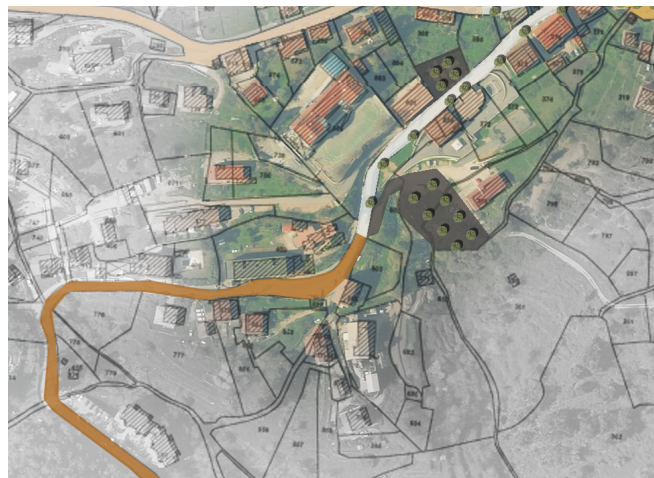
Repérage sur plan masse

Les abords des stationnements sont aménagés en promenades et paysagés, une attention particulière sera apportée à la signalétique et à l'éclairage. Le cœur du village est redonné au piétons et aux circulations douces.