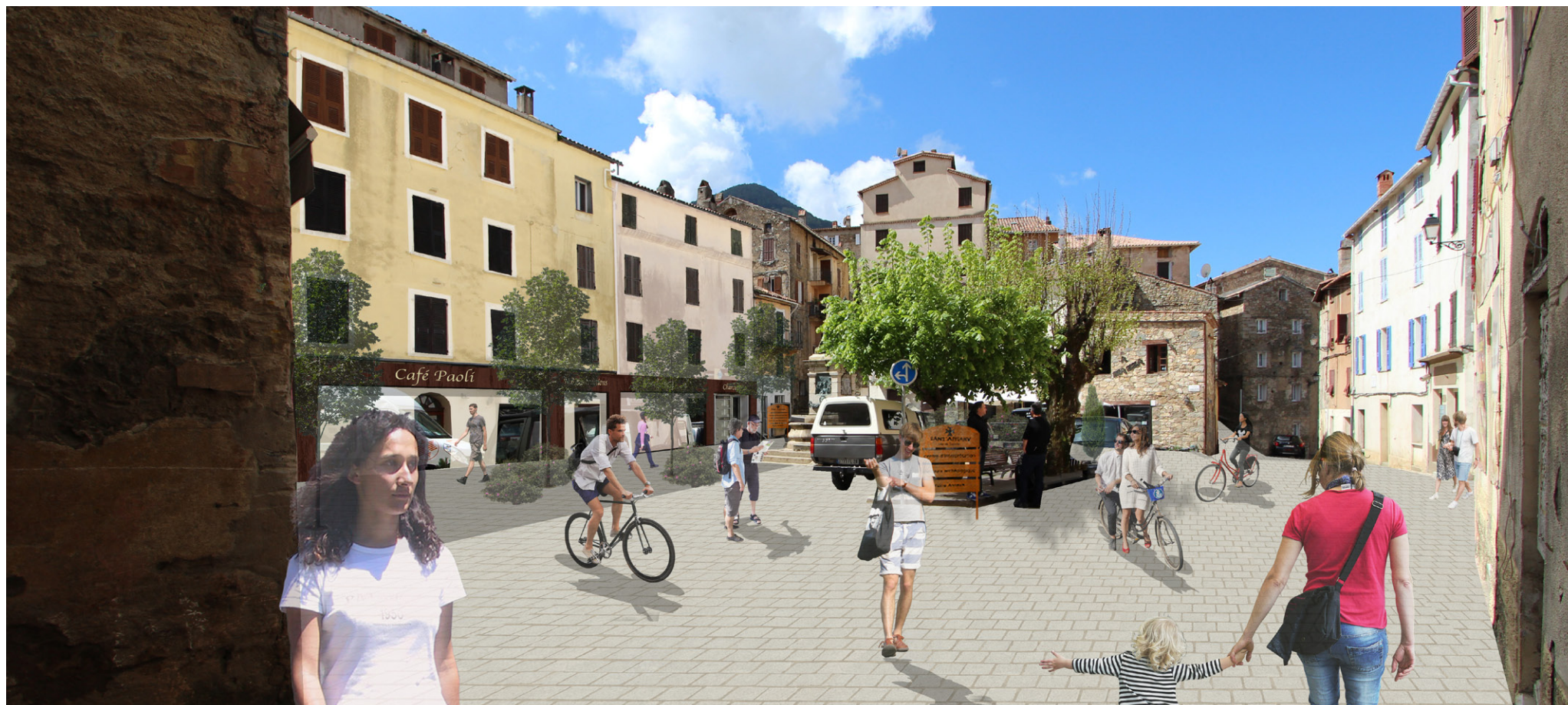
Vue de la place Casanella D'Istria - Etat projeté