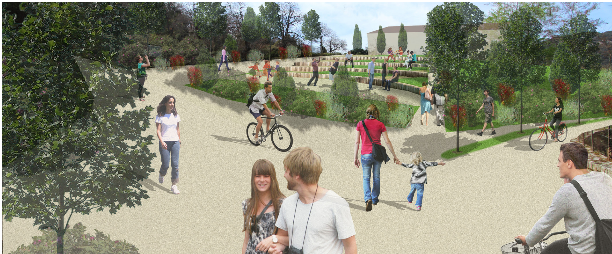
Vue d'un futur équipement, le pôle culturel - Etat projeté