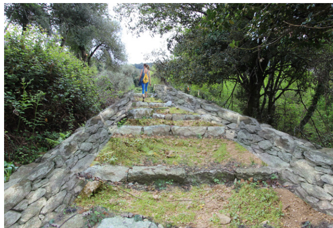
Vue du sentier entre le couvent Saint-François et le village - Etat projeté

Le patrimoine sera lui aussi mis en valeur, tel que les fontaines, les chapelles ou le couvent.