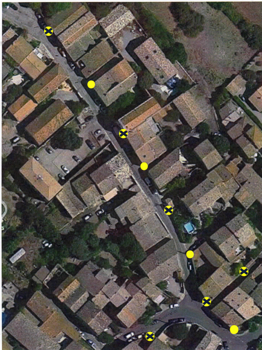
Photo satellite de l'avenue Georges Clémenceau mettant en valeur la position des lampadaires existants et ceux dont la suppression est suggérée. 9 octobre 2019