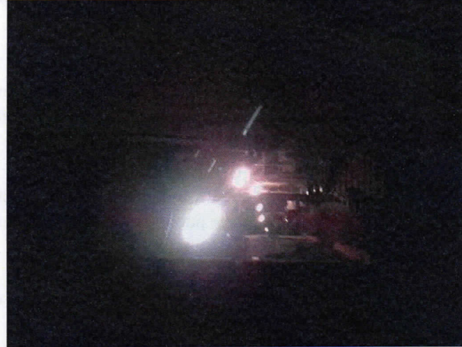
Avenue Georges Clémenceau