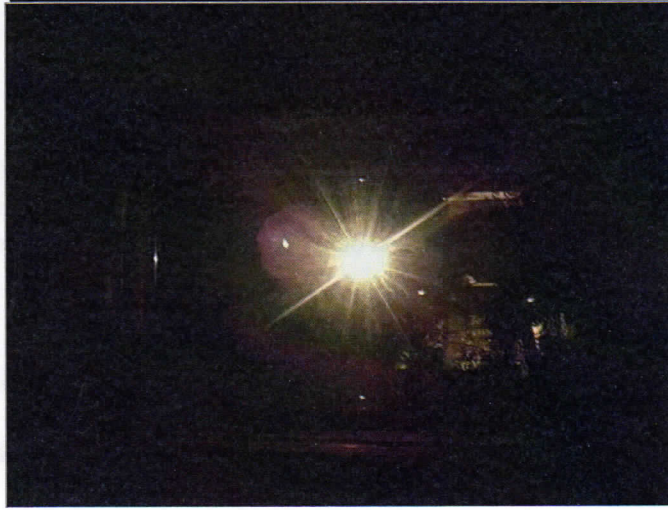
Rue Cave coopérative