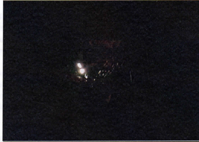
Rue des soupirs