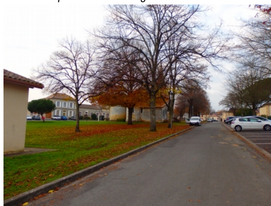
4 - Vue Est depuis la rue du lotissement communal