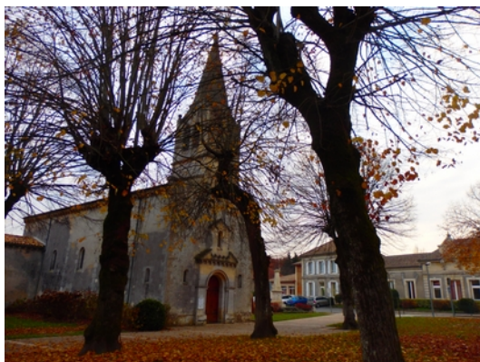
1 - Vue Nord-Ouest sur l'église depuis la route de Préchac