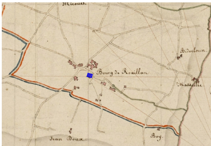
Cadastre « dit napoléonien » de 1812 (église Saint-Louis en bleu)