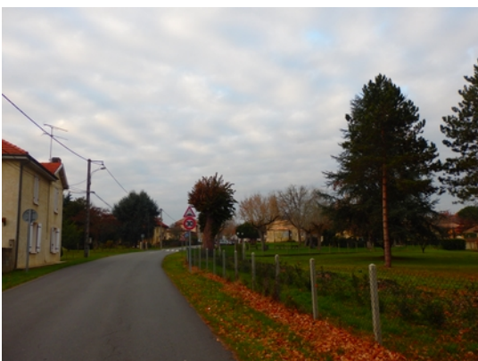
3 - Vue Sud-Est depuis la rue Clavier