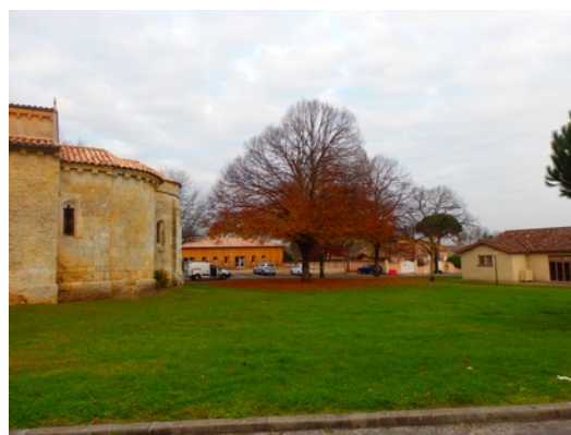
2 - Vue depuis le Sud de l'église