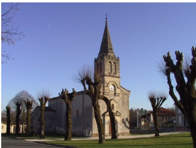
Vue de l'église (Nord-Ouest)

L'abside et l'absidiole sud de l'église Saint-Louis sont inscrites au titre des monuments historiques par arrêté du 24 décembre 1925.