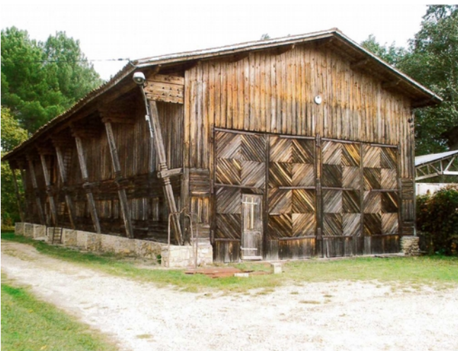
Façade d'arrivée Sud