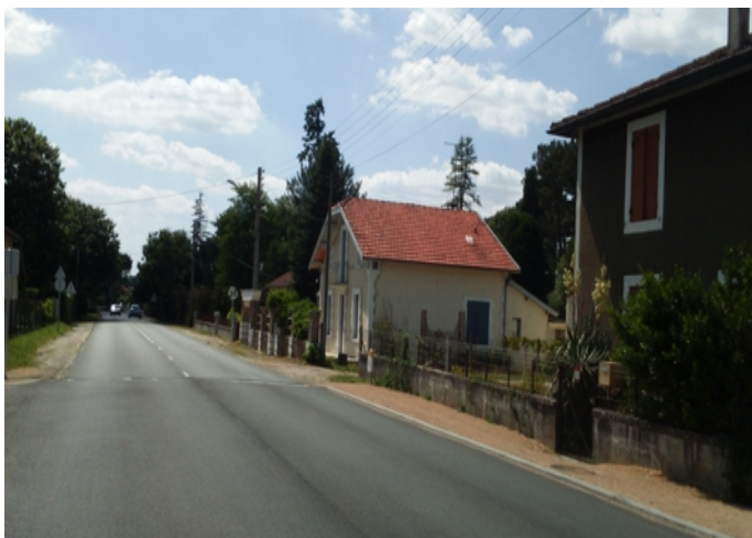
1- Avenue Jean Jaurès, au Sud-Est de la grange