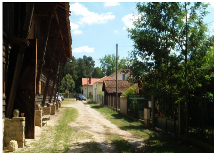
2 – Façade Ouest de la grange vue vers le Sud