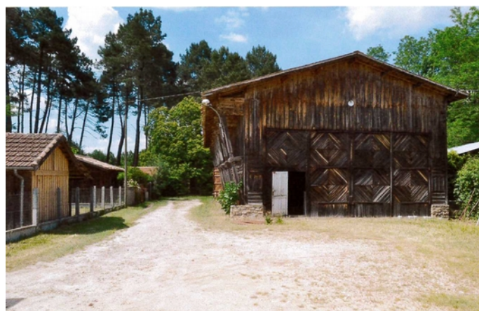
4 – Vue de la façade Nord, depuis l'avenue Jean-Jaurès