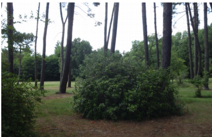
3- La pinède au Nord, un espace boisé classé