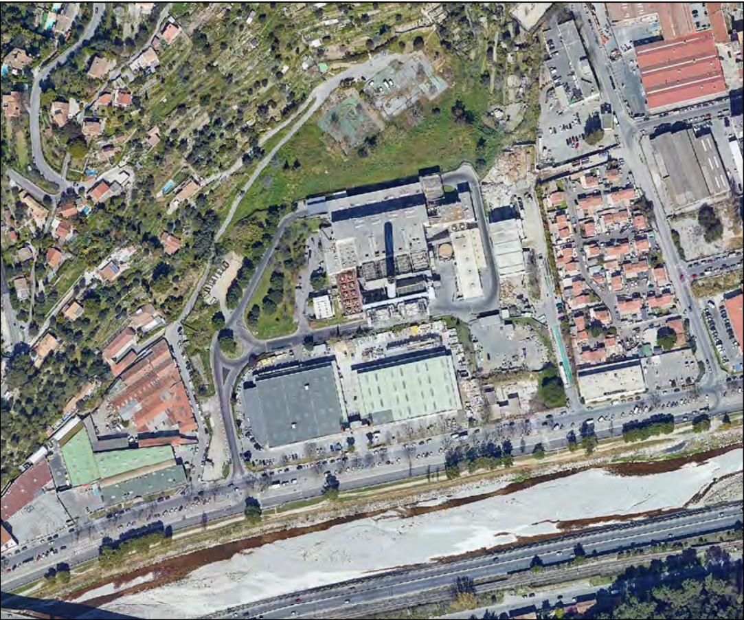
Vue aérienne du site