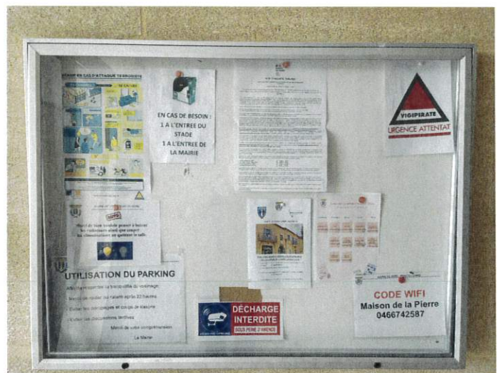
Maison de la pierre