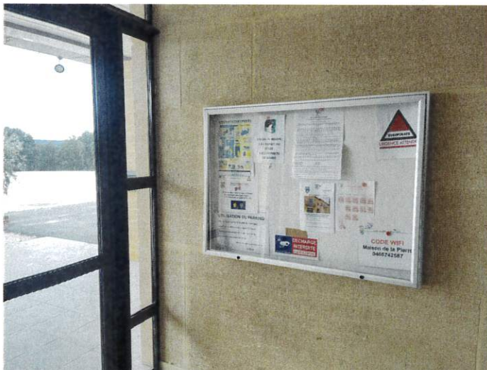
Maison de la pierre