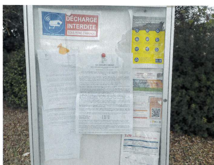
Rond point du Pont du Gard