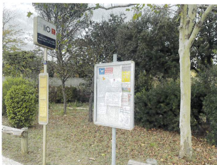
Rond point Pont du Gard