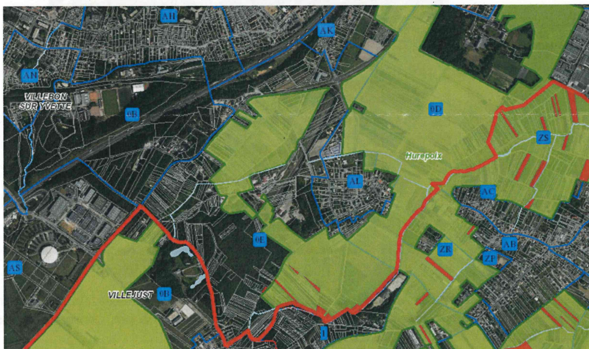
Le PRIF du Hurepoix et les propriétés régionales sur le territoire de Villebon-sur-Yvette

Au sein de ce périmètre, la Région Île-de-France est propriétaire de 347 ha, gérés par IDF Nature. Sur le territoire de Villebon-sur-Yvette, le PRIF du Plateau de Saclay couvre une surface de 106 ha (cf. contour vert sur la carte ci-dessous) dont moins de 1 ha sont propriétés de la Région Île-de-France (cf. aplat rouge ci-dessous).