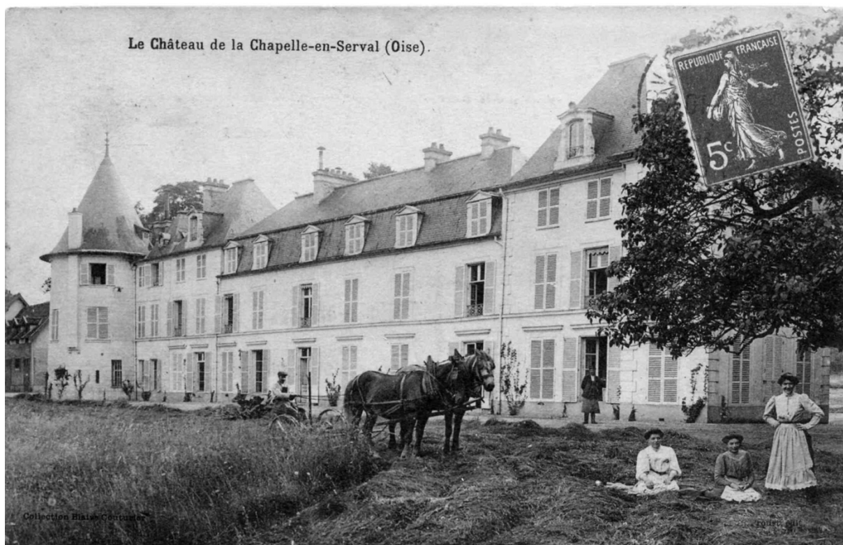
Prieuré de la Chapelle en Serval